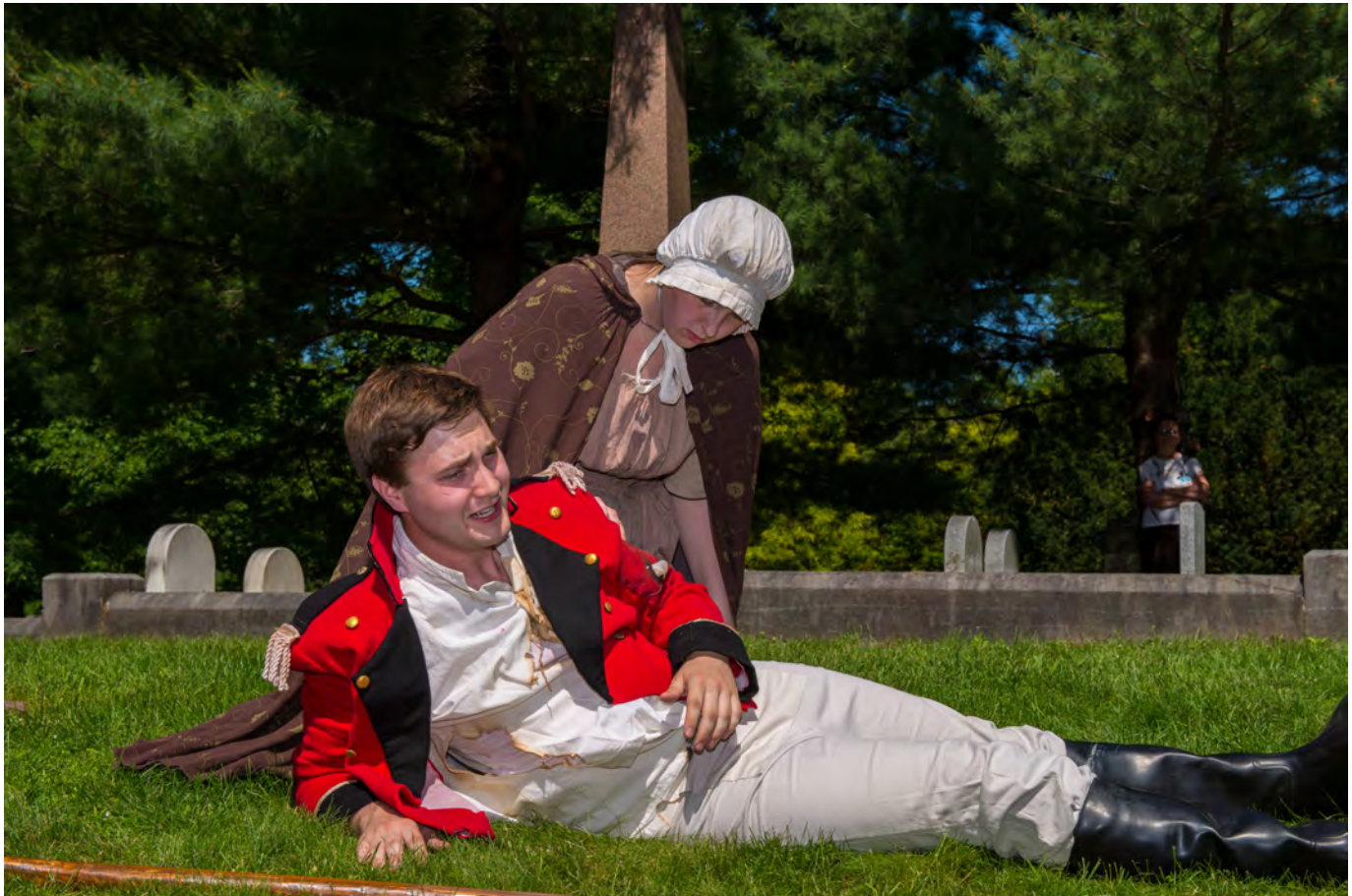
Acteurs incarnant le sergent Andrew Hill et Maria Hill lors de la visite historique annuelle de 2013 organisée par la Fondation du cimetière Beechwood.

Beechwood, cimetière national du Canada, demeure un mémorial vivant — un pont entre le passé et le présent. Ces récits constituent un devoir de mémoire, rappelant que nos libertés ont été façonnées en partie par le courage de ceux qui ont combattu durant la guerre de 1812.