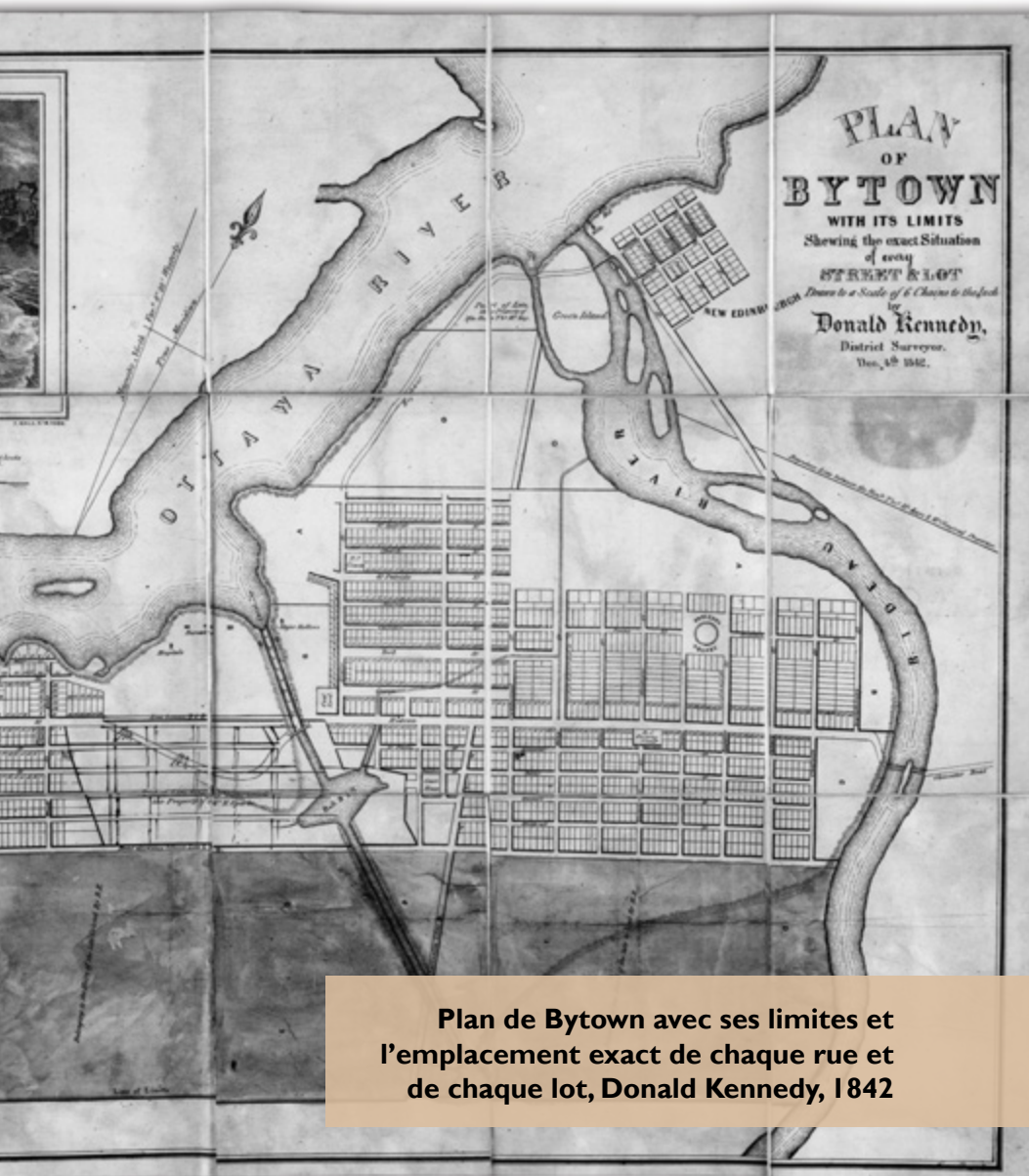
Plan de Bytown avec ses limites et l'emplacement exact de chaque rue et de chaque lot, Donald Kennedy, 1842