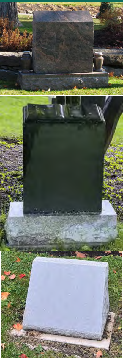
Fosse monument Hickey avec plaque de bronze verte