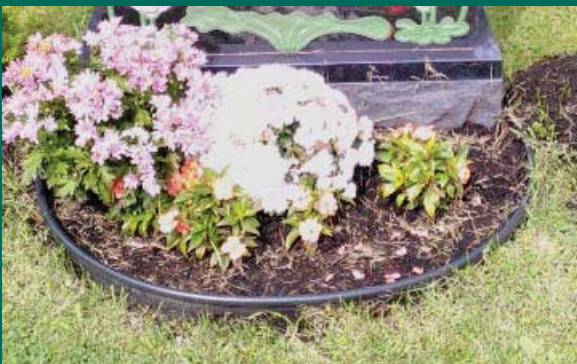
Exemples de bordures, clôtures, rampes approuvés.

6. Bordures. Afin de faciliter le fonctionnement du cimetière et pour la sécurité de ses employés, seules des bordures noires en plastique PVC ne dépassant pas 10,16 cm (4 po) de haut hors sol sont autorisées et peuvent être installées pour délimiter le périmètre de la zone de plantation approuvée.