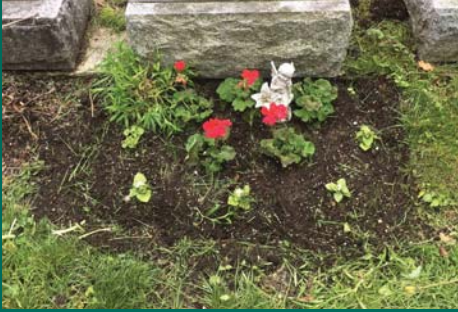
Exemples de parterres de fleurs approuvés.