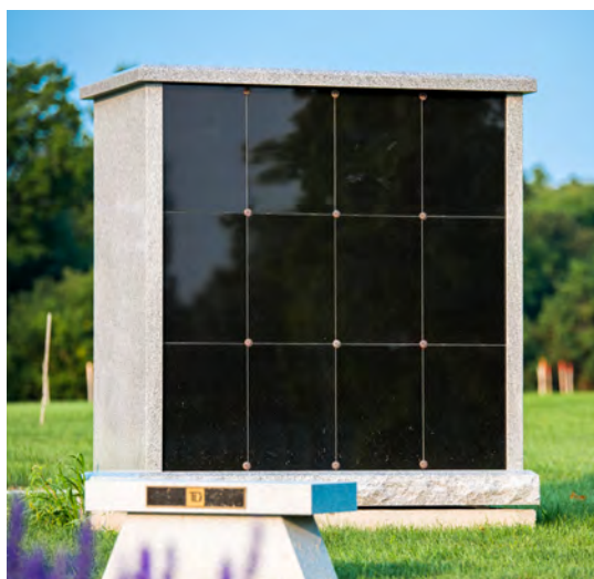
Niches en columbarium