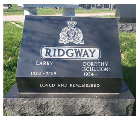
Lot de crémation avec monument 4 x 5 4 urnes. (Monument Includ)