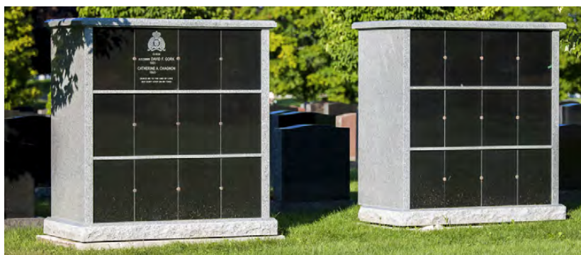
Niche GRC 2 urnes. (Plaque en granit)