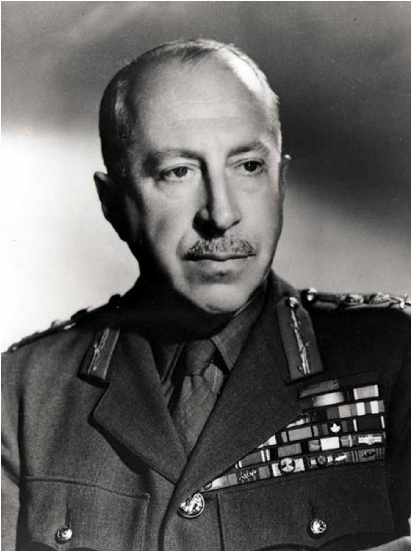
General H.D.G. Crerar