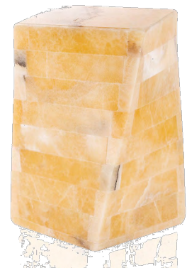
Onyx Torsado Joyal & Allard 125156 Pierre naturelle (6" l x 6" p x 10" h) 595,00 $