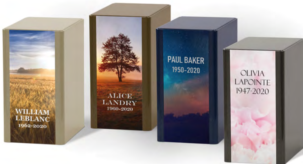
Collection Versatile Bégin

* selon la disponibilité, taxes non-incluses