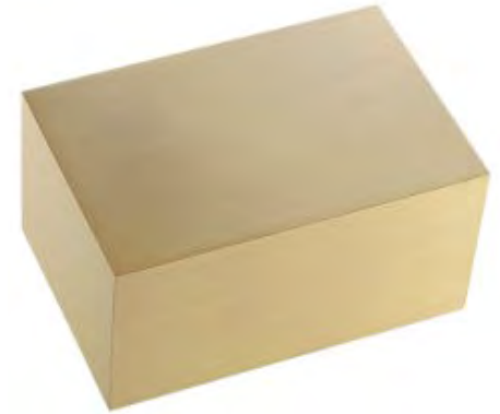
Coffret en Bronze

Zinc et Bronze (4 5/8" p x 7 5/8" l x 8 5/8" h) 1 265,00 $ (chaque)