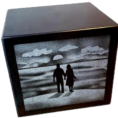
Walking Couple MCM Double Urne Granit (9 1/4" l x 8 1/2" p x 8 1/4" h) 1 775,00 $

* selon la disponibilité, taxes non-incluses