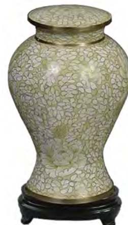
Cloisonné Élysse Bleue Eckels 160L - Opale Eckels 162L Urne en cloisonné à poli étincelant avec divers tons. (7" p x 11" h) 825,00 $