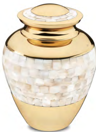
Nacre de perle distingué Eckels MOP Fabriqué à la main de laiton avec mosaïque polie (7" p x 9 1/4" h) 595,00 $