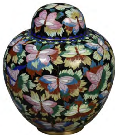
Cloisonné avec papillons Eckels 832 Fait main en cuivre avec fini en émail (8" p x 9 1/4"h) 825,00 $