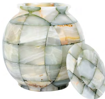
Triumph Onyx Green Northern TOG-01 Pierre naturelle (9 1/2" l x 8 1/4" d) 695,00 $