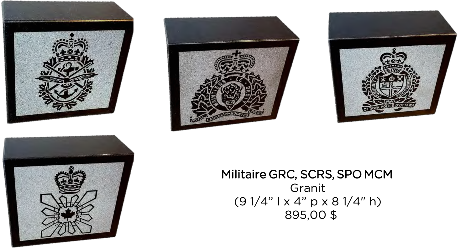
Militaire GRC, SCRS, SPO MCM Granit (9 1/4" l x 4" p x 8 1/4" h) 895,00 $

* selon la disponibilité, taxes non-incluses