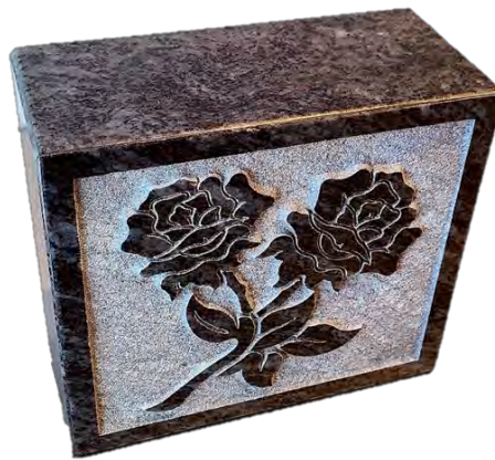
Oiseaux, Roses MCM Granit (9 1/4" l x 4" p x 8 1/4" h) 895,00 $