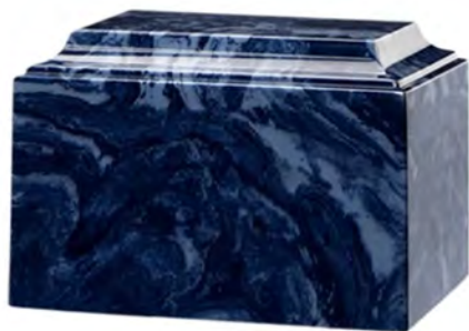
Classique Bleue Eckels 213 Marbre cultivé (9 3/4" w x 6 3/4"d 6 1/2"h) 455,00 $

* selon la disponibilité, taxes non-incluses